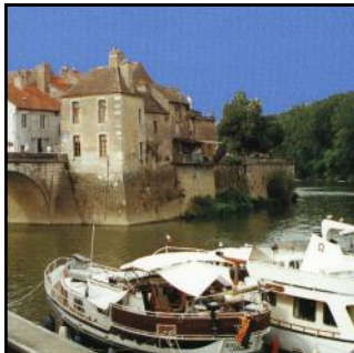
Embarcadère de Verdun sur le Doubs

Cette randonnée permanente en Bresse Bourguignonne est une invitation à la découverte de toutes les richesses architecturales, culturelles, ethnologiques, et gastronomiques de cette région.