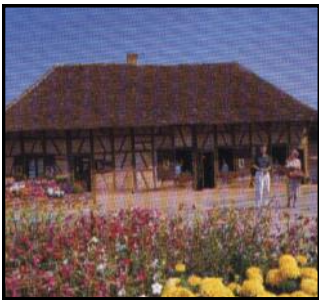
Ferme Bachelet—St Germain du Bois